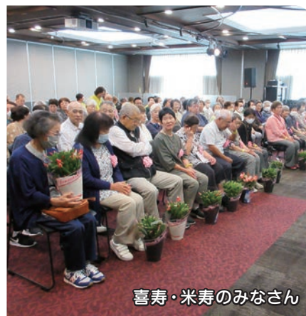
喜寿・米寿のみなさん