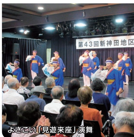
よさこい「見遊来座」演舞