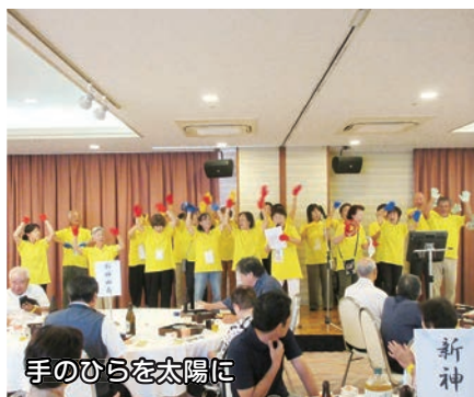
手のひらを太陽に