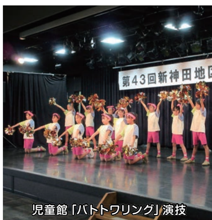
児童館「バトワリング」演技