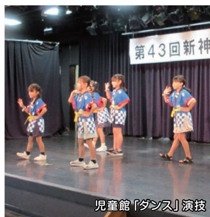
児童館「ダンス」演技