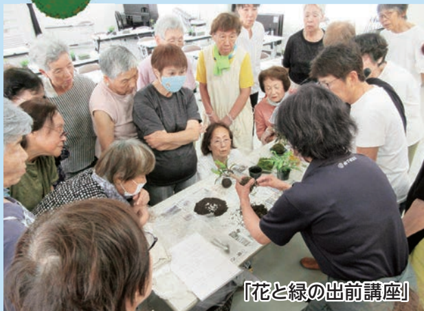
「花と緑の出前講座」