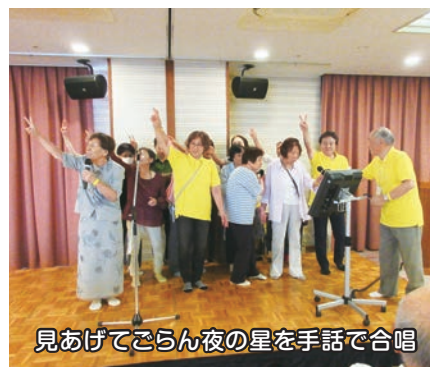
見あげてごらん夜の星を手話で合唱